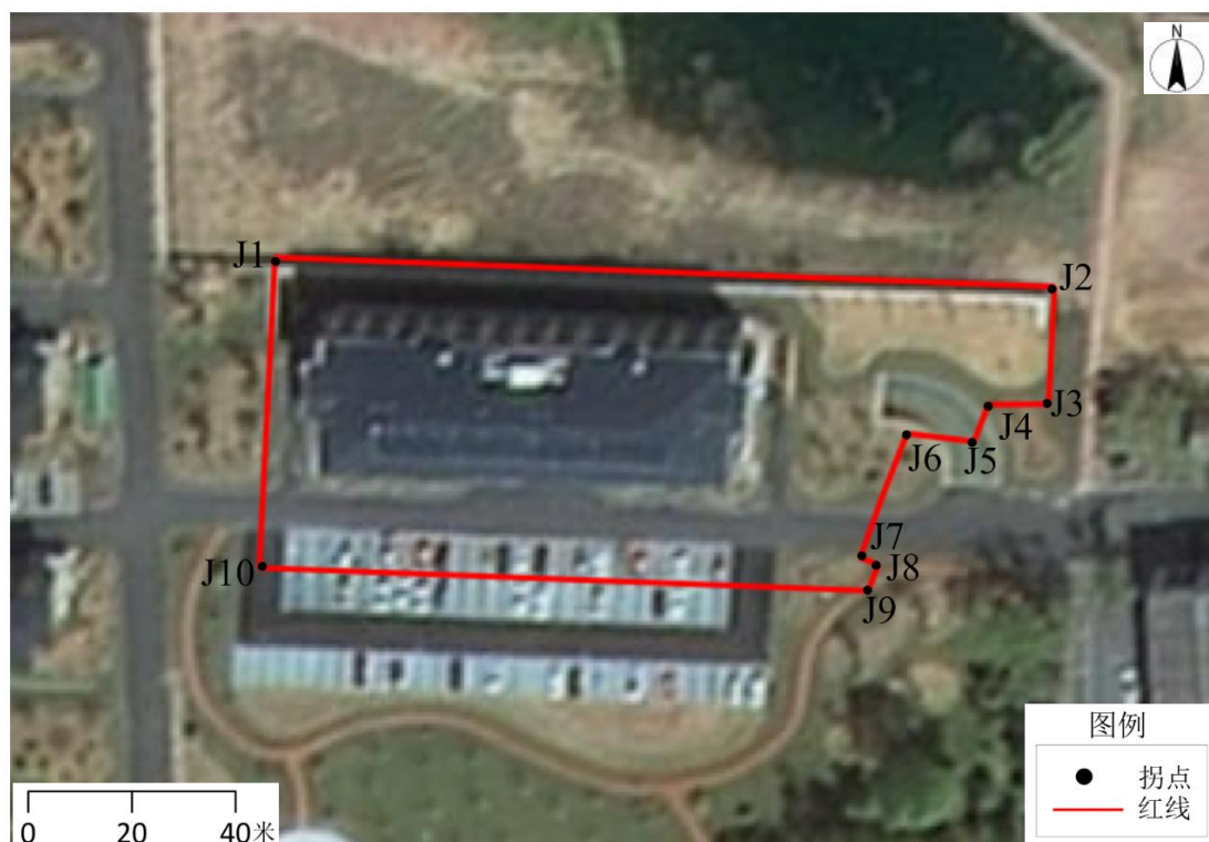
图 2-1 地块红线范围及拐点坐标图